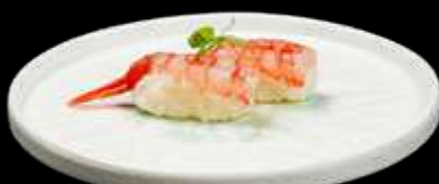
188. NIGIRI AMAEBI gambero crudo. €4.00