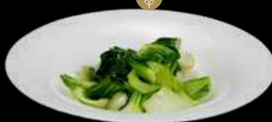
296. XIAO BAI CAI SALTATO verdure cinesi verdi saltate €8.00