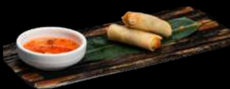
O15. HARUMAKI 1pz, involtino di gamberi, verdure e carne €3.00