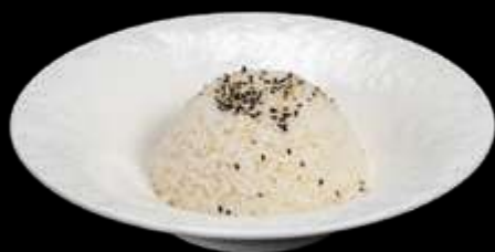
251. RISO BIANCO €2.00