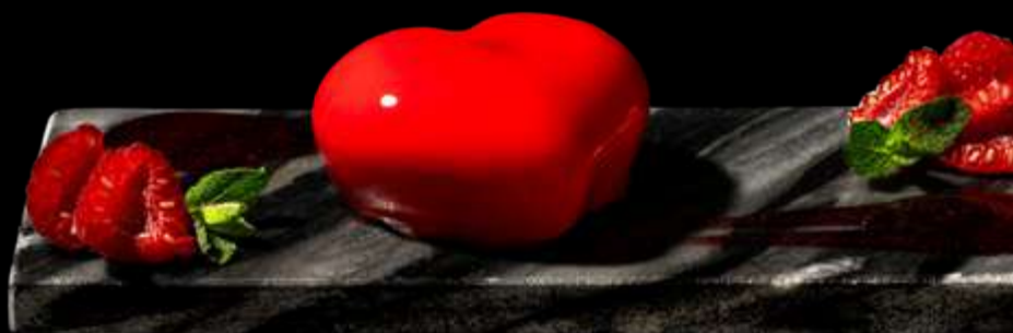
PASSIONE mousse al cioccolato bianco con un cuore di gelée al lampone e lime. Un abbraccio fresco e raffinato €7.00