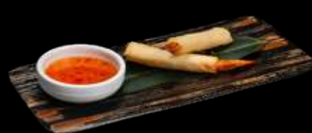
O16. EBI STIK 3pz, gamberi fritti avvolto con foglio di primavera. €6.00