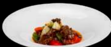
290. MANZO IN SALSA PICCANTE manzo, peperoni, cipolla e salsa piccante €6.00