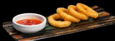
O22. ANELLI DI CIPOLLE €6.00