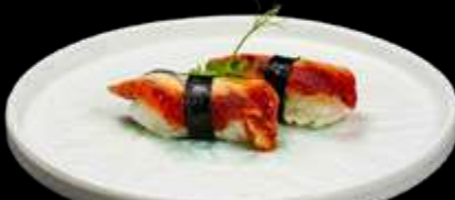
191. NIGHIRI ANGUILLA anguilla con teriyaki €5.00