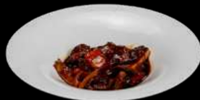
291. MANZO AL PEPE NERO manzo con peperoni e bambù al salsa pepe nero €6.00