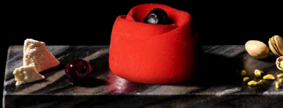
RUBICONDA Mousse al cioccolato bianco che incontra una crema al pistacchio, ricoperta da una glassa all'amarena e completata da un'amarena intera. €7.00