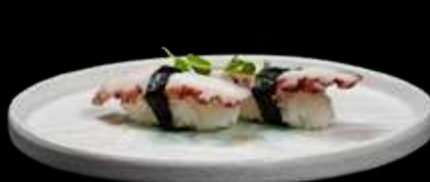
190. NIGIRI TAKO polpo. €3.00