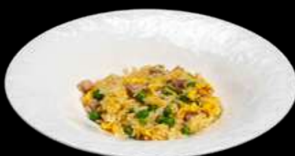
252. RISO ALLA CANTONESE Riso bianco saltato con uova, verdure e prosciutto. €6.00