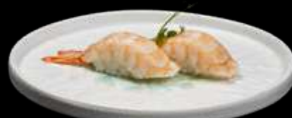
189. NIGIRI EBI gambero cotto. €3.00