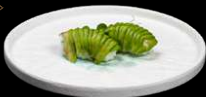
184. NIGIRI AVOCADO avocado. €3.00