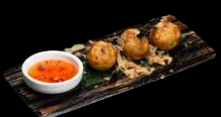
O19. TAKOYAKI 3pz, Polpo, farina, maionese, scaglie di pesce essicato. €6.00