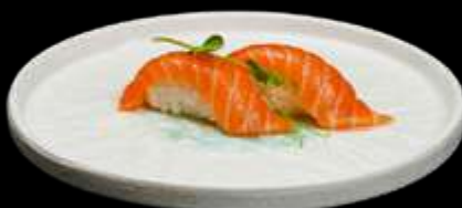
185. NIGIRI SAKE salmone. €3.00