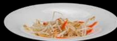
294. GERMOGLI DI SOIA germogli di soia con carote saltate €8.00