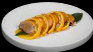
293. ANATRA ALL'ARANCIA anatra, arancia e salsa arancione €6.00