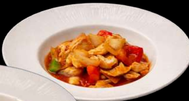
297. POLLO THAI pollo con peperoni cipolle verdure in salsa Thai €7.00