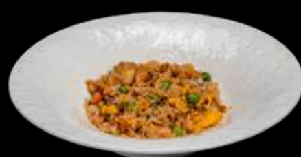
256. RISO CON PESCE ALLA GIAPPONESE Riso bianco saltato con uova, verdure, pesce misto alla salsa giapponese di soia.