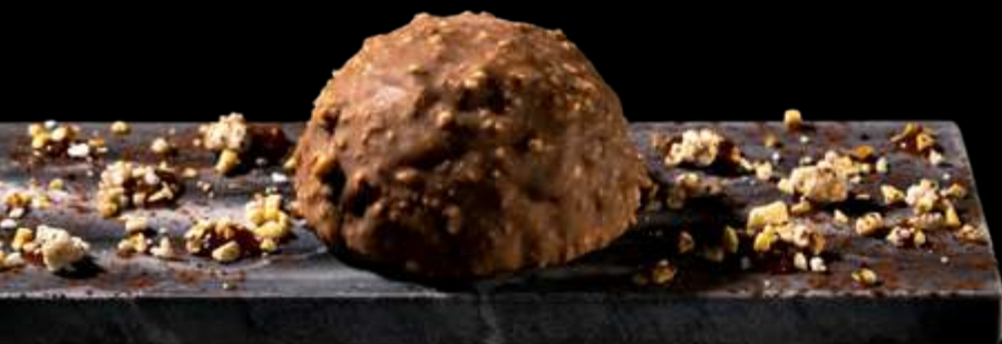
LA GOLOSA (SENZA GLUTINE) un croccante strato di cioccolato al latte e nocciole avvolge una mousse alla nocciola con un sorprendente ripieno di nocciole caramellate €7.00