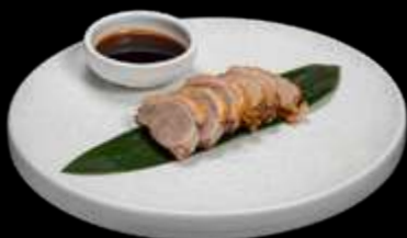
292. ANATRA ARROSTO €6.00