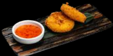
O20. KOROKKE 2pz, crochetta di patate giapponese €6.00