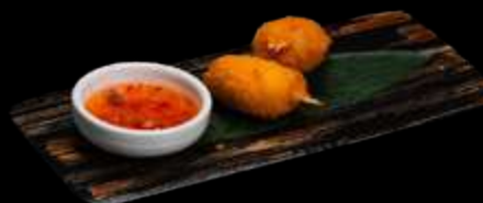
O21. CHELE DI GRANCHIO FRITTO 3pz, pasta di farina, arrotolata con granchio €6.00