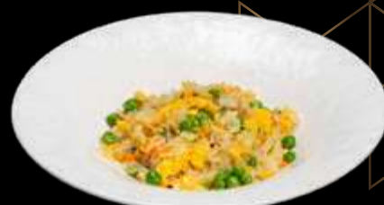
253. RISO CON VERDURE Riso bianco saltato con uova e verdure. €6.00