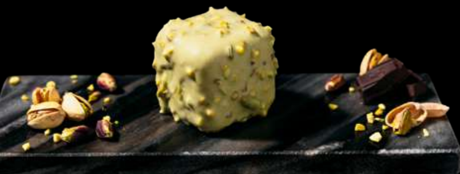
PISTACCHIOSA deliziosa mousse al pistacchio con granella, avvolta in una irresistibile glassa croccante al pistacchio. €7.00