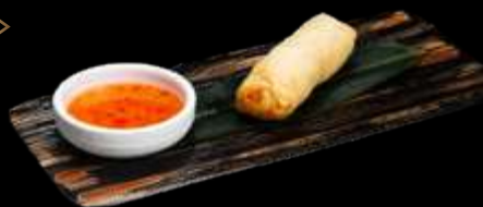
O14. INVOLT. PRIMAVERA 1pz, involtino di verdure. €2.00