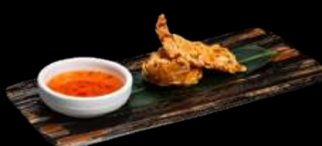
O17. GAMBERI IMPANATI CON MANDORLE 3pz, gamberi impanati con le scaglie di mandorle €6.00