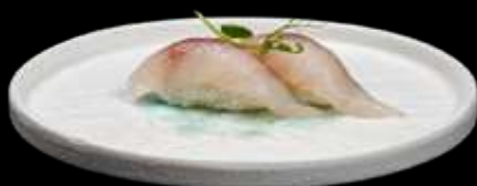
187. NIGIRI SUZUKI branzino. €3.00