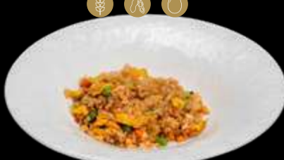
255. RISO SALTATO CON SALMONE Riso bianco saltato con uova, salmone e salsa soia.