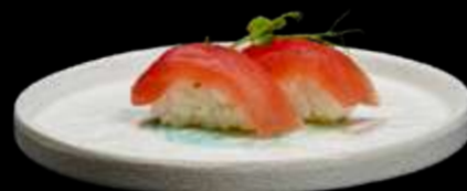
186. NIGIRI TEKKA tonno. €3.00