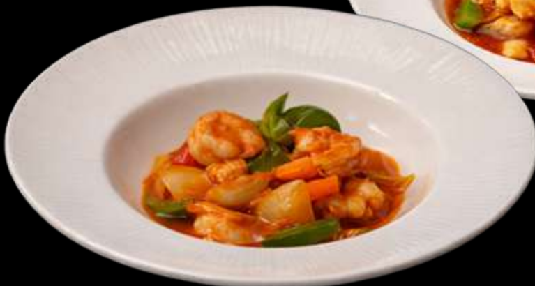
298. GAMBERI THAI gamberi con peperoni cipolle verdure in salsa Thai €9.00