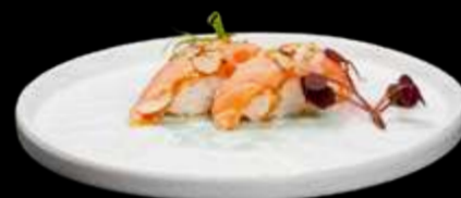
192. NIGIRI SALMONE COTTO salmone alla fiamma con salsa latte, teriyaki e mandorle. €4.00