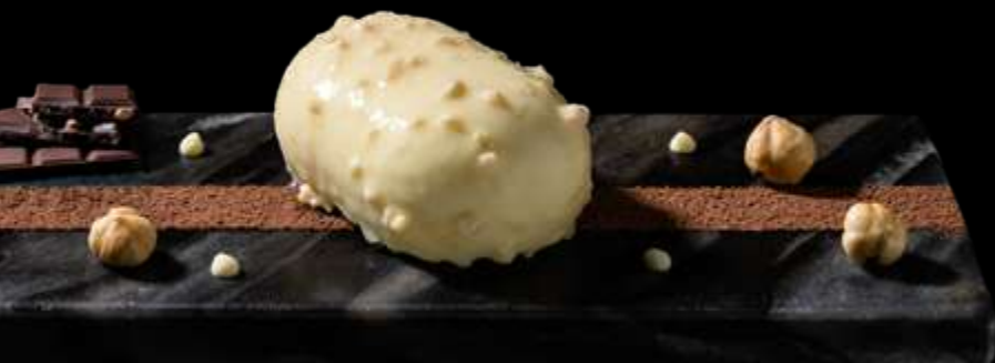
BACIO BIANCO (SENZA GLUTINE) guscio croccante alle nocciole con strati di crema al cioccolato bianco, vaniglia e nocciole, su una sablé alla nocciola: un dolce ricco e avvolgente. €7.00