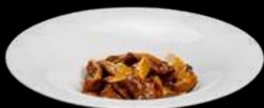
289. MANZO CON FUNGHI E BAMBU manzo, funghi e bambù €6.00