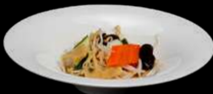
295. VERDURE MISTE SALTATE carote bambù zucchine funghi cinese saltate €8.00