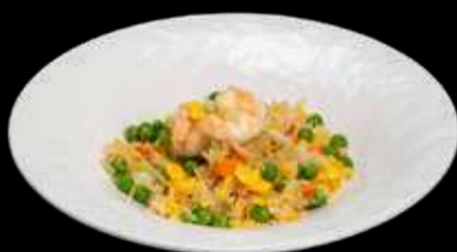
254. RISO CON GAMBERI E VERDURE Riso bianco saltato con uova, verdure e gamberi.